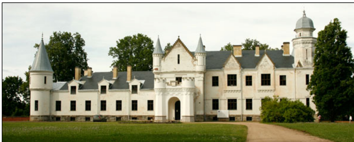
Joonis 1. Alatskivi loss